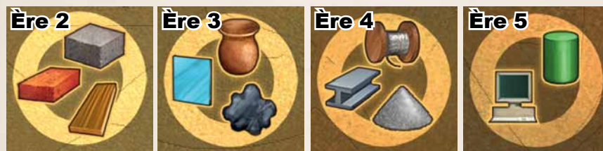
Table des ressources disponibles à la banque